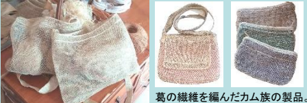
葛の繊維を編んだカム族の製品。